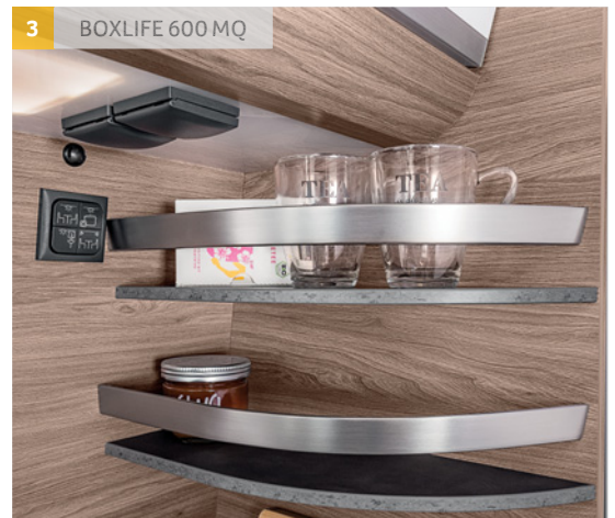
3 BOXLIFE 600 MQ