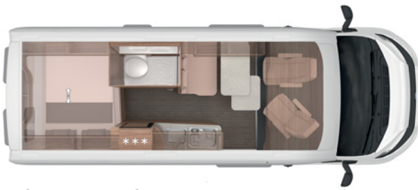
BOXLIFE 600 MQ

Einfach mehr Wohnkomfort. Und dabei extrem praktisch konstruiert mit intelligenten Details , flexiblen Lösungen, extrem viel Stauraum und exzellenter KNAUS CUV Qualität . Hier müssen Sie auf rein gar nichts verzichten.