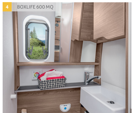
4 BOXLIFE 600 MQ