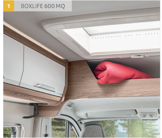
1 BOXLIFE 600 MQ