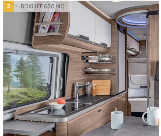
2 BOXLIFE 600 MQ