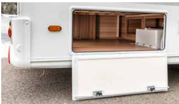
Großzügige, gut zugängliche Stauräume