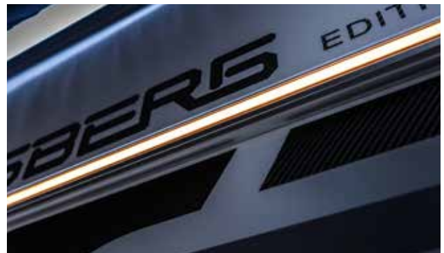
LED Beleuchtung + Glattblechausführung