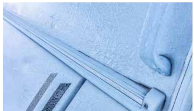
Glattblech, Markisenleiste und XPS-Schaum Isolierung