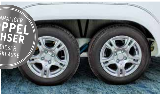
Tandemachse für mehr Fahrkomfort

EINMALIGER DOPPEL ACHSER IN DIESER PREISKLASSE